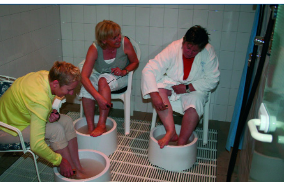
Abb. 3: Kommunikativ: Die basische Fußbaderunde

Und bieten mir das hervorragende Stichwort für das Kapitel, das den Reigen der ganz spezifischen und unvergleichbaren Leistungen des Kneipp- und Vitalhotels eröffnet: