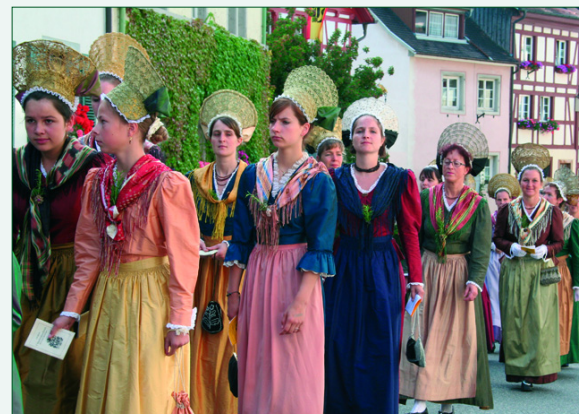
Abb. 4: Die Überlinger Schwedenprozession erinnert an die Niederschlagung der schwedischen Belagerung im Dreißigjährigen Krieg mit der Hilfe des Himmels