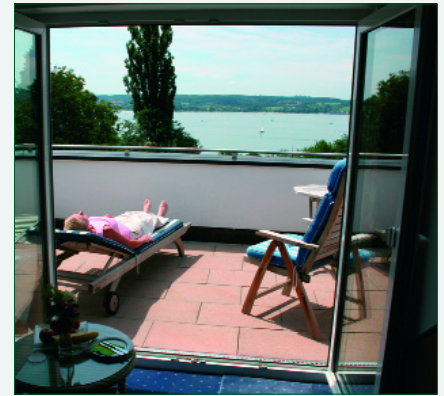
Abb. 7: Zimmer mit Ausblick: Ambiente à la Röther zum Ersten

sehr viel von dieser Ausbildung, die ein sehr umfassendes Wissen vermittelt. Gute Kneipp-Bademeister seien sehr gesucht heute. Kneipp erlebe nach seinem Erleben derzeit eine Renaissance, sei aktueller denn je. Ein großer Vorteil für die Jentschura-Gäste übrigens, die auch von diesem Schwerpunkt des Hauses profitieren, wie Sie noch erleben werden.