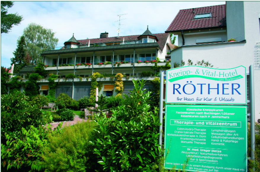
Abb. 1: Einladend: Das Kneipp- & Vital-Hotel Röther

lisch, Niederländisch, Russisch und Lettisch übersetzt wurde. Die Lizenzen für Tschechisch, Slowenisch, Serbisch und Koreanisch sind an diese Länder verkauft.