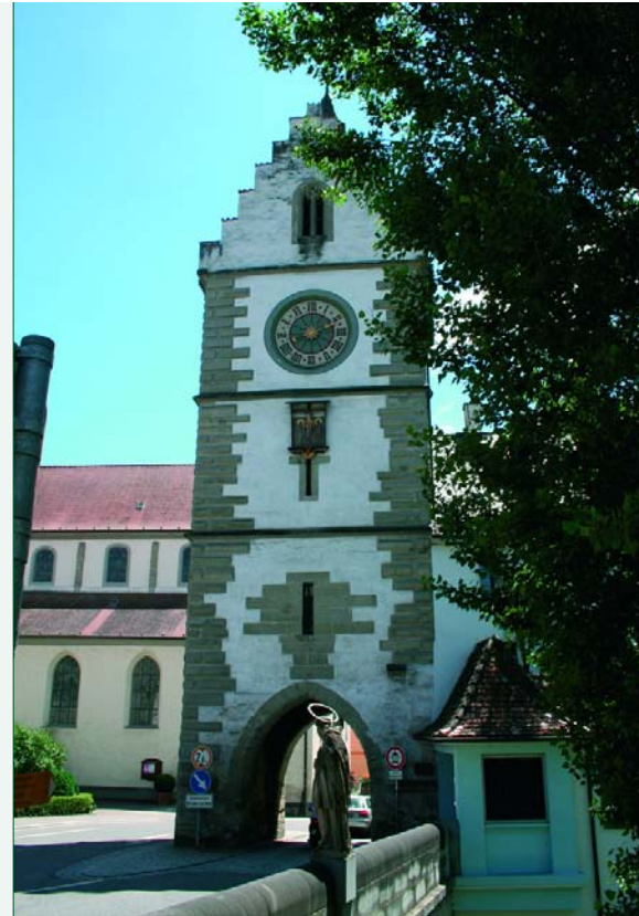
Abb. 2: Freie Reichsstadt Überlingen...