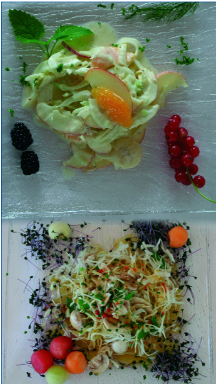
Abb. 6: Mittags: Salatvariationen...

mine, S, D, E, und K, Spurenelemente und bioaktive Substanzen sowie wichtige Mineral- und Vitalstoffe und bildet insofern im Konzert mit dem „7x7 KräuterTee“, einer Mischung aus 49 Kräutern, Samen, Gewürzen, Wurzeln und Blüten und der basischen Körperpflege „Meine-Base“ mit einem pH-Wert von 8,5 das unverzichtbare Gerüst der BasenKur des Peter Jentschura.