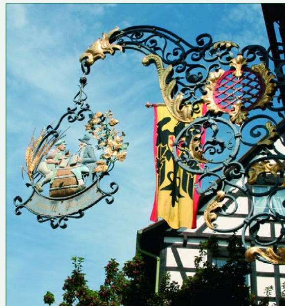
Abb. 3: ...Lebensqualität pur, auch für Wein- (Bier- und Most-)Genießer