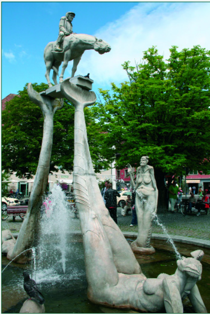
Abb. 5: Umstritten und berühmt: Der Brunnen von Peter Lenk

dem mediterran zu nennenden Seeklima verdankt das: „Premium-Kneipp-Heilbad“ nicht nur die üppige Pflanzenpracht und das faszinierende Kakteen-Freigelände, sondern auch das Attribut: „Riviera am Bodensee“.